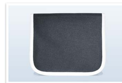
Custodia da viaggio