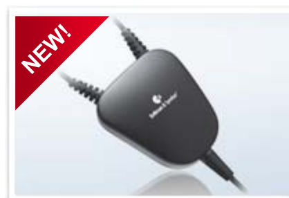
Laccio collo induttivo