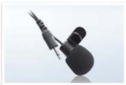
Microfono a cravatta