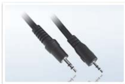
Kit cavo 5m