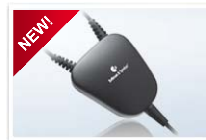
Laccio collo induttivo