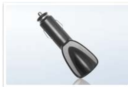
Caricatore da auto